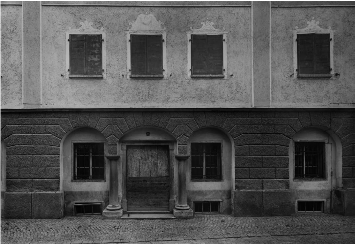
Petra Wunderlich, Zuoz San Bastiaun 2, Silbergelatine-Abzug auf Baryt, 2007, 68 cm x 82 cm