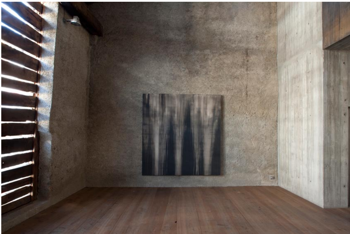
Callum Innes, Monologue Twenty Eight, 2008, Oil on Canvas, 240 cm x 232 cm