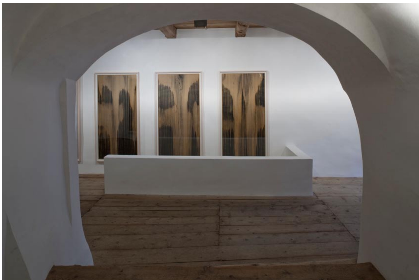
Callum Innes, Untitled, from the Cento Series, 2008, Ausstellungsansicht