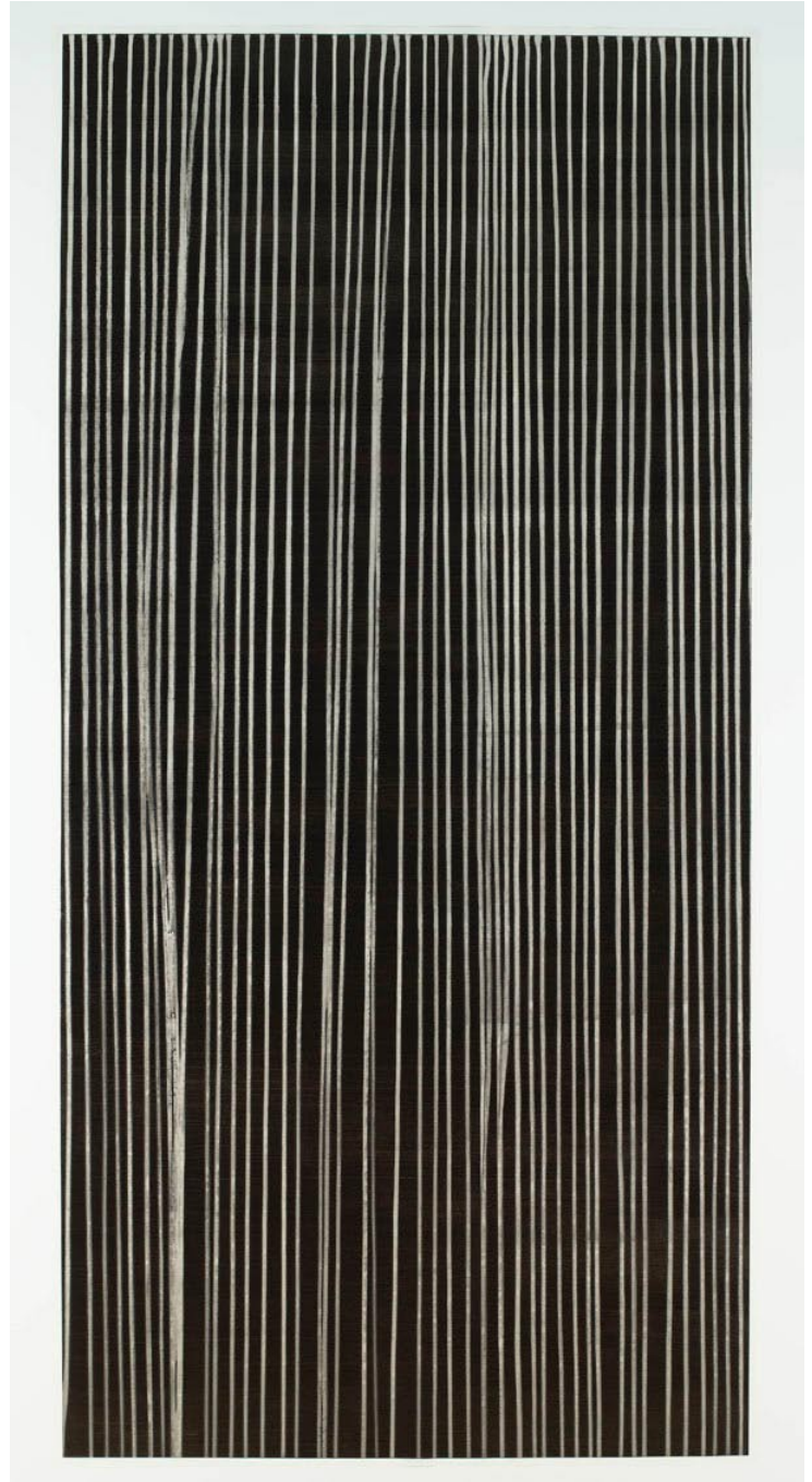
beide: Callum Innes, Untitled, from the Cento Series, 2008, Oil on oil paper, 205 cm x 100 cm